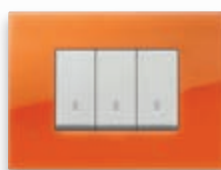
Classic - 63 Orange