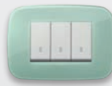
Round - 65 Salvia