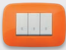
Round - 63 Orange