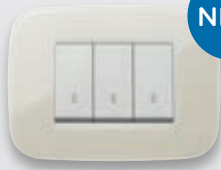
Round - 67 Avorio