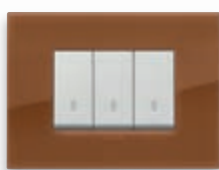
Classic - 62 Caramel