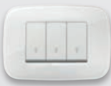
Round - B66 Ghiaccio total look (con diaframma bianco)