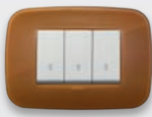
Round - 62 Caramel