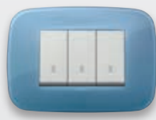
Round - 64 Oltremare