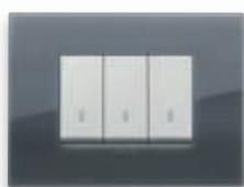
Classic - 61 Grigio fumé