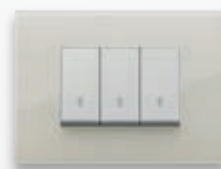
Classic - 67 Avorio