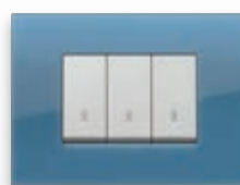
Classic - 64 Oltremare