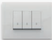
Classic - B66 Ghiaccio total look (con diaframma bianco)