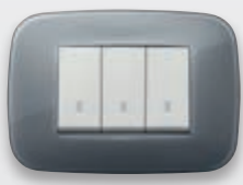
Round - 61 Grigio fumé